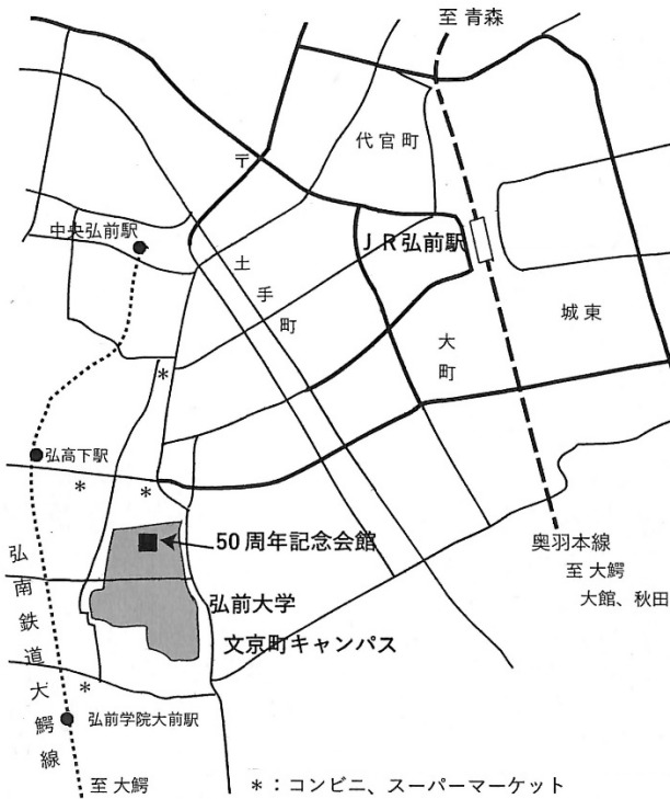
<JR 弘前駅から会場までのアクセス>